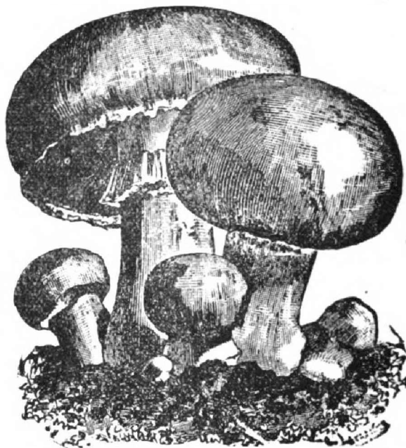
Agaricus edulis , Bull.

He aquí una fuente de riqueza que puede explotarse fácilmente en el país y cuyas conveniencias fluyen sin disputa alguna del gran consumo anual del producto en todos los centros poblados de la República, pues bien conocido es el