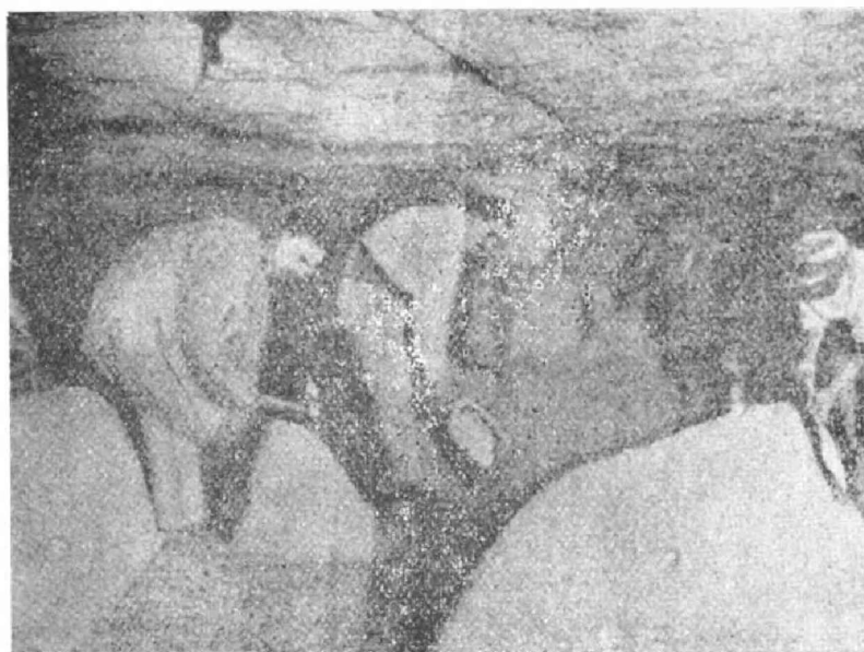
Formando los montículos destinados á recibir el «blanco» ó micelio del hongo.

Deben preferirse los montículos en caballete ó á dos declives, sobre todo si se dispone de un local suficientemente extenso. En este caso la longitud será arbitraria ó como mejor se desee.