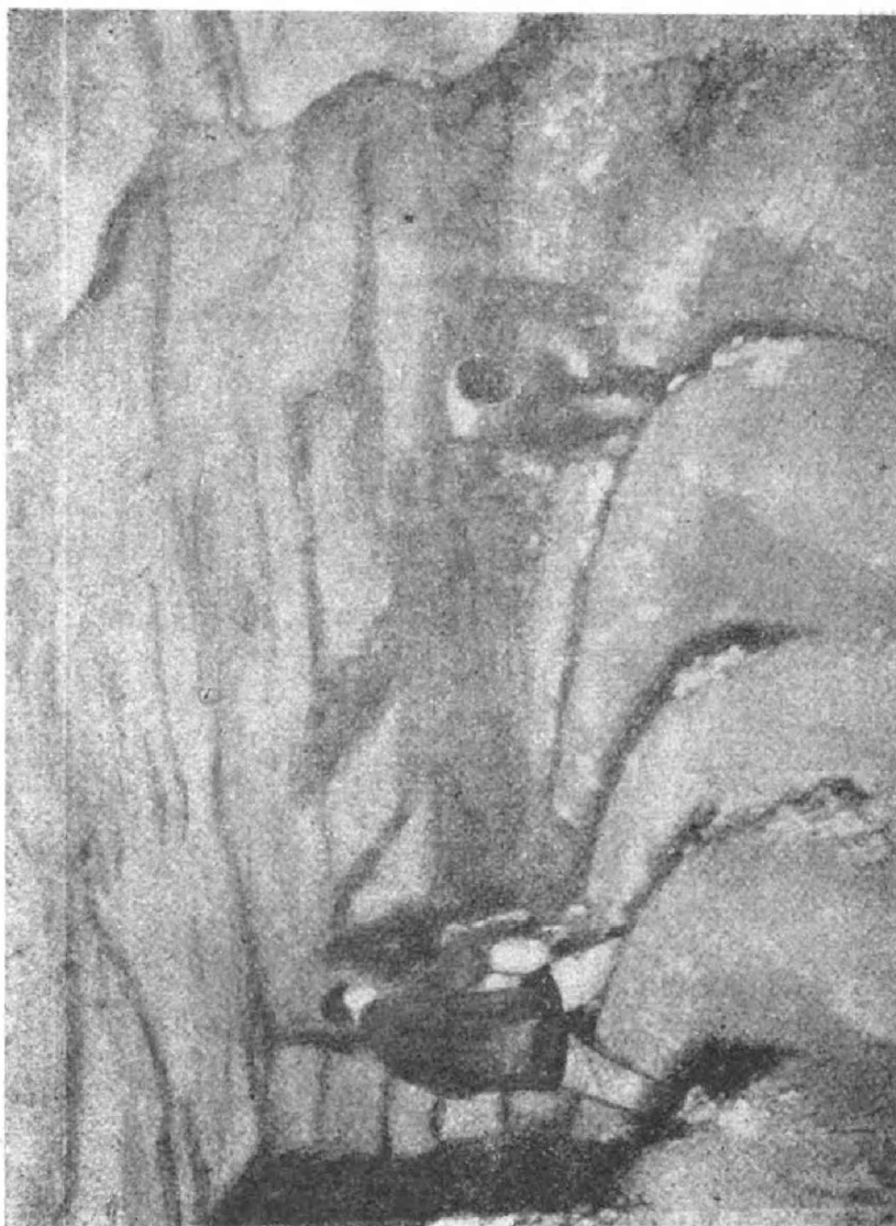
Riego y cosecha del hongo comestible.

eligen los que vegetan separados unos de otros en los pares más altos y expuestos al sol. Por otra parte, no es difícil distinguir un hongo comestible de otro malo: el primero